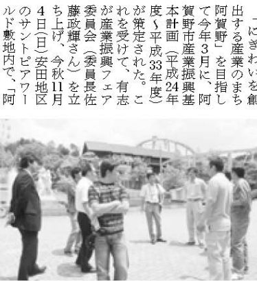
サントピアワールドを視察の委員会メンバー

また、開催までの過程で従来の地域の枠にとらわれないネットワークづくりを図り、産業振興の